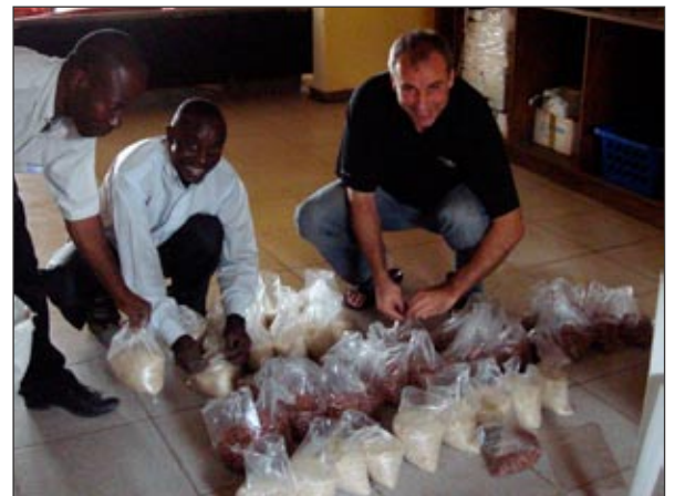
Préparation des colis alimentaires à la maison...