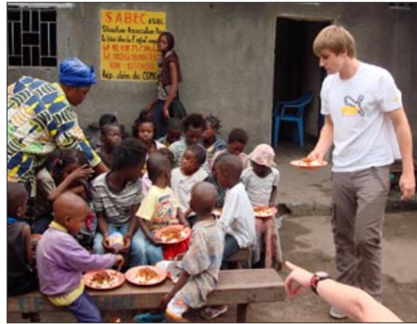
Le petit, au milieu, là, n'a toujours pas d'assiette!

chissante. La vie au Congo nous dote de 3 vertus essentielles, fut son constat après avoir partagé notre quotidien rempli d'embûches: La patience, la foi, et un esprit positif, même lorsque tout va de travers!