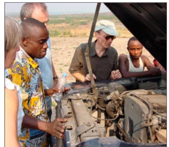
Les routes sableuses de Mokali . Pourquoi cette voiture ne veut-elle pas démarrer?