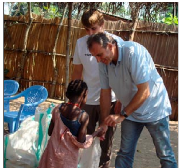
... puis distribution à Mokali