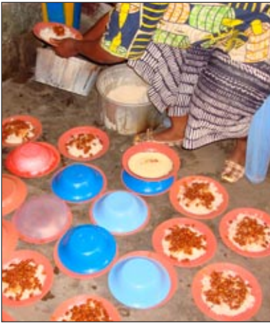
Kisenso: Florence en action