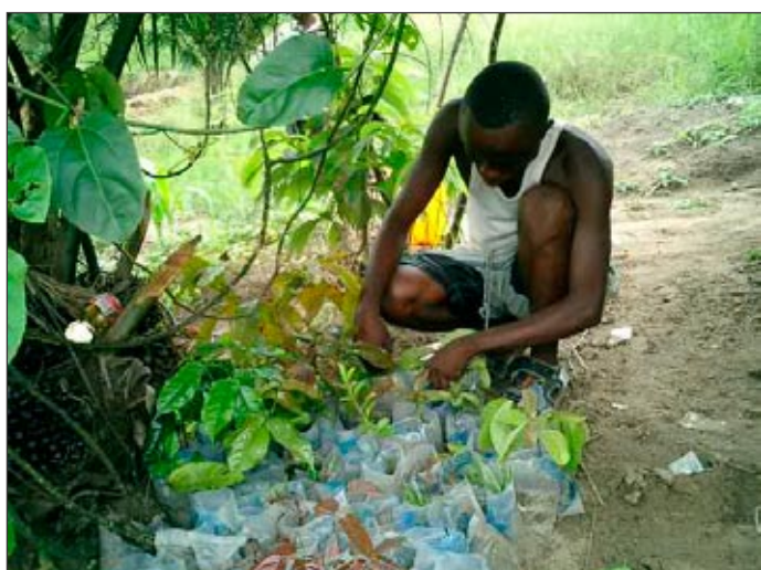
Récoltés de notre jardins et replantés à Mokali: Petites pommes africaines, avocats et bananiers