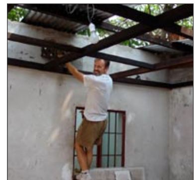
Tout le toit s'est effondré