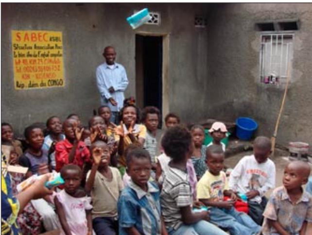
Qui attrape le premier ce paquet de biscuits?

tion des orphelins et de leur offrir un meilleur futur, nous nous sommes proposés un nouveau but pour eux. La première nécessité pour les enfants est une nourriture équilibrée, assurance d'une meilleure immunité contre la maladie. Conjointement, nous aimerions que chaque enfant ait une éducation scolaire de base. Pour couvrir ce besoin, nous faisons de