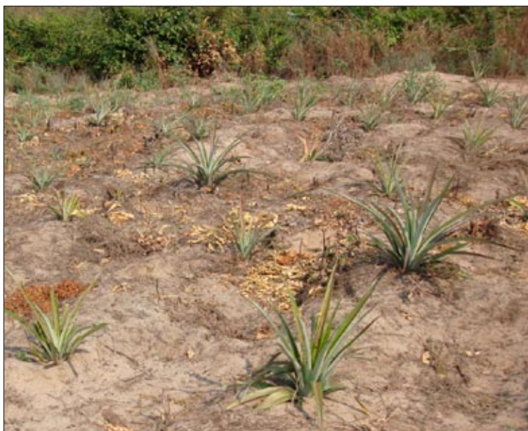
Les Ananas et autres petits arbres fruitiers à Mokali

rouge, les UN, ou autres dénominations religieuses, nous ne percevons aucun salaire. Chaque volontaire de notre équipe est autofinancé, et notre reconnaissance va à nos amis et parents qui nous supportent par leurs dons financiers. Aujourd'hui, notre équipe s'étant agrandie, nos dépenses quotidiennes aussi s'accroissent.