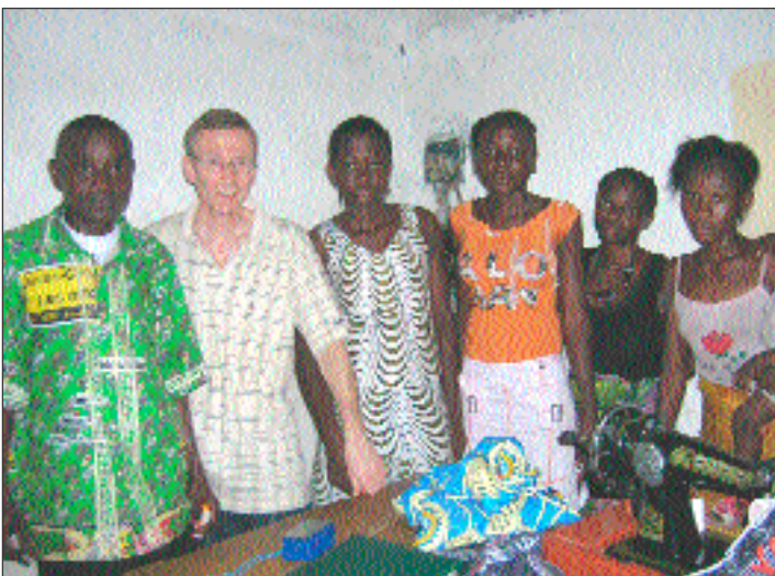
Nos machines à coudre sont très utiles à Kisenso

Wolfgang, Lenka et l'équipe du Congo DRC