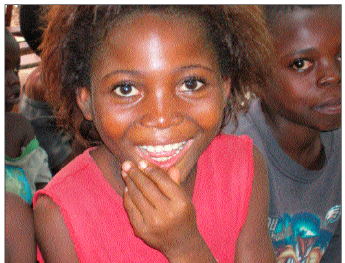
Les orphelins sont heureux de votre aide!

Compte bancaire: Aktive Direkt Hilfe e.V., Postbank Dortmund, number 298 000 461, BLZ 440 100 46, IBAN: DE 92 4401 0046 0298 0004 61, BIC: PBNKDEFF