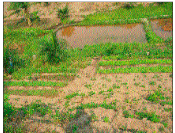
Deux des trois futures mares aux poissons.

Notre projet agricole à Kikimi progresse. Le long du petit ruisseau, nous avons commencé à aménager trois étangs en vue de la culture de poissons. Cependant, nous avons besoin d'investir plus de temps, de planification, et de finances avant de concrétiser ce projet. Nous avons aussi planté d'avantage de cassavas (pommes de terre africaines). Cependant, parce que la terre dans cette région est sablonneuse, des études supplémentaires s'imposent afin d'augmenter la productivité des cultures.