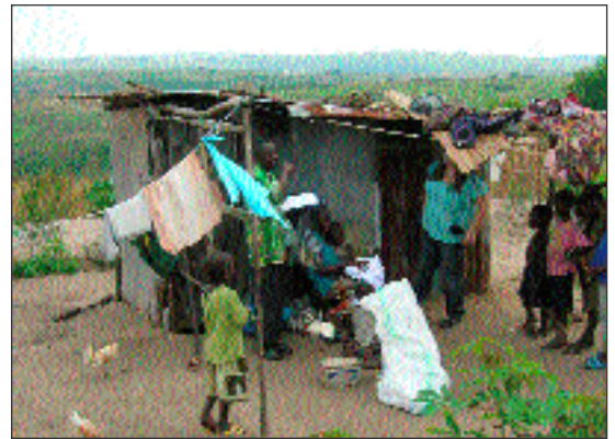
La cabane pour grand-mère Fatu, le bébé et deux petits orphelins.

suffisent plus pour couvrir les besoins alimentaires des enfants. Or, ils ont également besoin d'habits, de chaussures, d'un minimum de médicaments contre la malaria ect. Notre vision est également de pourvoir à leurs besoins scholastiques élémentaires. Pour voir s'accomplir cette vision pour le futur des enfants, nous cherchons des sponsors pour construire un bâtiment en dur sur notre champs à Kikimi, où les enfants pourraient vivre et évoluer. Au delà donc de l'alimentation des enfants, de grands et nouveaux challenges nous attendent! Cependant, nous sommes vraiment reconnaissants pour la nourriture quotidienne des enfants, désormais assurée. Un grand merci à nos sponsors locaux pour leur aide complémentaire.