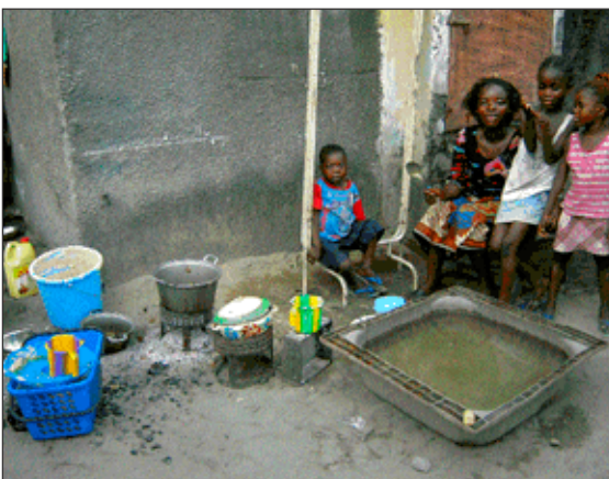
...avant le repas, on se lave les mains!