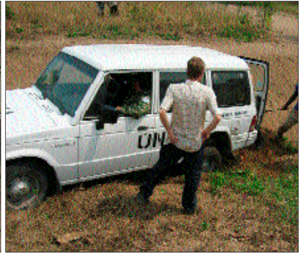
A gauche: Le Capitaine Oscar de la MONUC et son équipe, sont une grande aide pour le transport de la nourriture. A droite: Embourbés dans le sable de Kikimi.