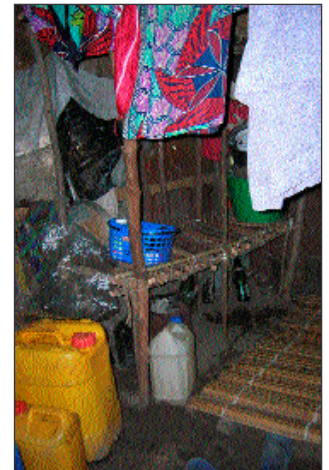
Grand-mère Fatu travaille encore au champ. Ici, sa petite cabane pour 4.