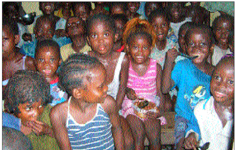
...avec les mains ou une cuillère, c'est vraiment délicieux!

Malheureusement, parce que la vie a augmentée, ici à Kinshasa, depuis l'an passé, 10 euros par mois et par enfant ne