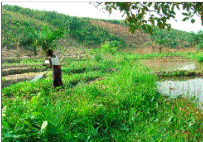
La colline aux cassavas, le champ de légumes, et les étangs près du ruisseau.

Le long du ruisseau, les légumes, bénéficiant d'un arrosage aisé, poussent très bien. Entre les cassavas, les ananas croissent à merveille, et les nombreux arbres fruitiers plantés sur l'entière propriété prospèrent. Il y a encore beaucoup d'espaces pour de nouvelles plantations! Nos remerciements