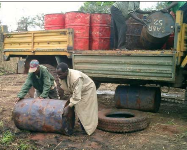
Zwanzig 200 Liter Wassertonnen auf der Baustelle.