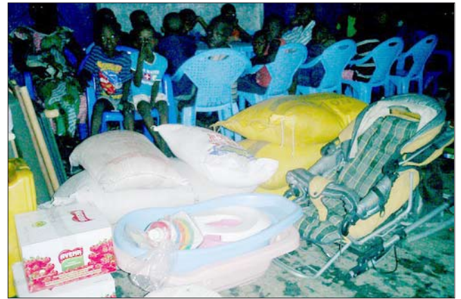
Verteilung von gratis Schulmaterial für Schulen und Waisenhäuser in Kinshasa und andere Hilfe für Waisenkinder.

Tickets regelmäßig sponsern, was unsere Aufgabe sehr erleichtert. Die Vodacom Stiftung will uns mit Schulbänken und Pulten helfen. Andere Leute gaben größere Spenden und boten an, mehr Unterstützung für unser Projekt zu suchen. Vielen Dank für all Eure Hilfe!