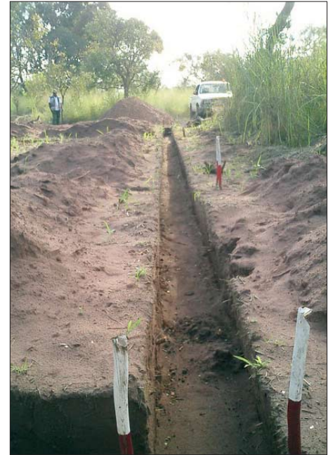
Fundaments Gräben für die Schule

Bevor wir nach Mushapo gehen konnten, um mit dem Bau zu beginnen, trafen wir alte und neue Freunde in Kinshasa, die begeistert sind von unserem Projekt und uns dabei unterstützen wollen. Zum Beispiel, CAA, die größte Fluggesellschaft, die von Kinshasa nach Tshikapa fliegt, der größten Stadt in der Region unseres Projektes, möchte unsere