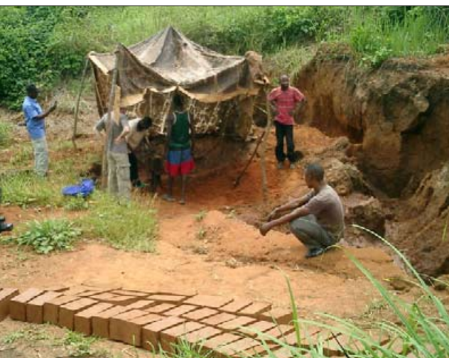
Hier werden mehr Backsteine gepresst u. getrocknet.