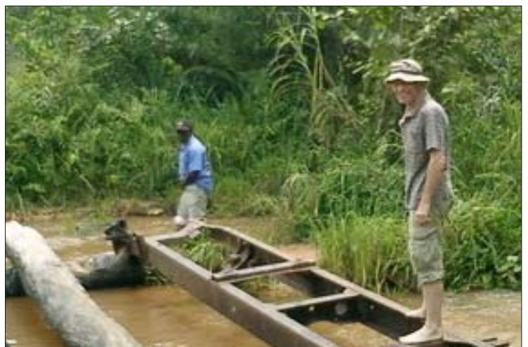
Wolfg. überquert Misangi Fluss - zu Fuß nach Shamubenze.

Spendenkonto: Aktive Direkt Hilfe e.V., Postbank Dortmund, Konto 298 000 461, BLZ 440 100 46