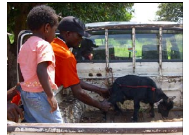
... traditionell eine Ziege.