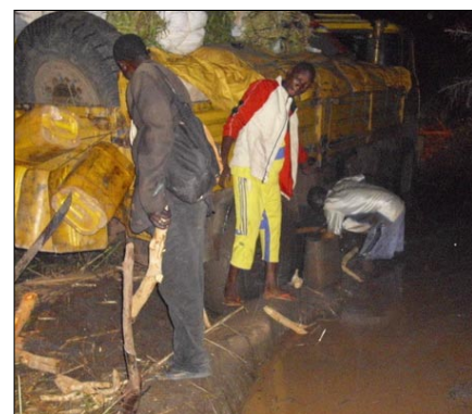
Nachts im Schlamm versackt: wir brauchten 12 Stunden für 65 km.