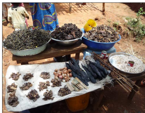
Getrocknete Raupen, Fische, Pilze u.a.