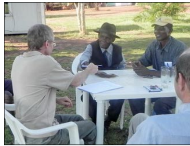
L: Gruppen-Chef überschreibt uns das Land. R: Wir bringen ihm ein Geschenk und erhalten als Dank für unser Projekt ...