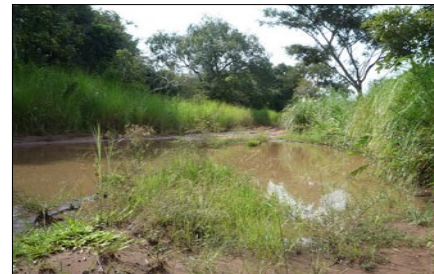
Verregnetes Straßenloch im Busch