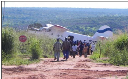
Buschflieger testet SADR Landebahn