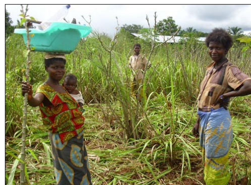
Manche Frauen arbeiten mit ihren Babys