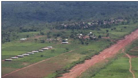
SADR Farm u. Camp vor Mushapo Dorf

Aktive Direkt Hilfe e.V., Hochend 2, D-47509 Rheurdt Tel: ++49 2845 980956 Email: schmidt@aktivedirekthilfe.de Tel in DR Kongo: ++243 81 6293157 oder ++243 99 1281444 Webseite: www.a-d-h.org