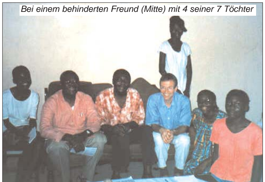
Bei einem behinderten Freund (Mitte) mit 4 seiner 7 Töchter

Dieses Anliegen sprach uns sehr an, und wir hoffen, dass wir auf meinem Deutschlandbesuch neben den üblichen Hilfsgütern ausreichendes Material für dieses Projekt sammeln und alles Nötige für den Container vorbereiten können. Dazu brauchen wir wieder Euer Gebet, denn nachdem alles abgeholt, sortiert und zum Aufladen bereitgestellt ist, brauchen wir wieder ein Wunder, um das Ganze durch den afrikanischen Zoll zu bringen!