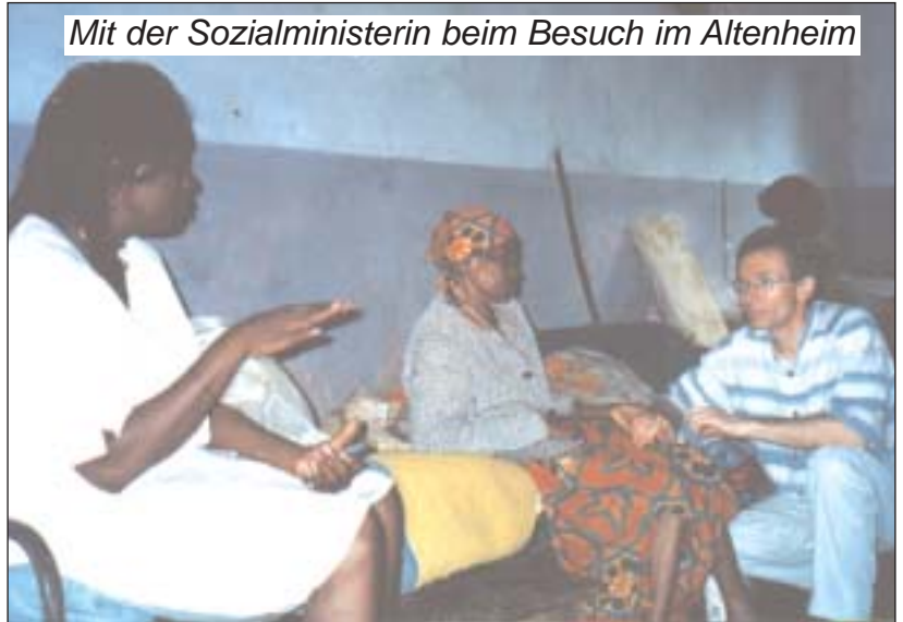
Mit der Sozialministerin beim Besuch im Altenheim