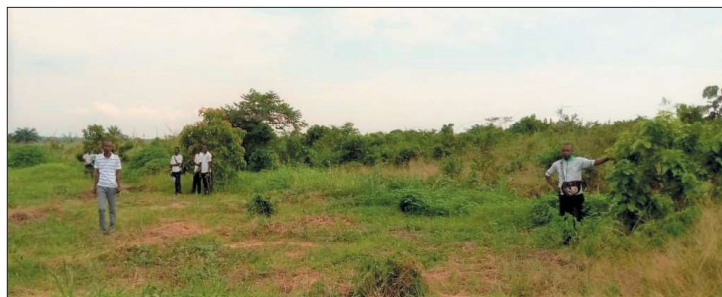
Učitel (vlevo) a žáci ukazují na avokádové stromy, které sázeli

Rádi bychom vás poprosili, jestli byste nám mohli pomoci šířit tyto důležité informace, abychom mohli v Kongu dosáhnout změn ve větším měřítku. Na straně 3 je věnování knihy: “Na podporu konžského lidu i pro osobní prospěch každého čtenáře” . Dalším účelem Wolfgangovy knihy je získat podporu pro nové projekty v Kongu. Jak je uvedeno na zadní straně obálky: “Výtěžek z této knihy je určen přímo na podporu školních projektů v Konžské demokratické republice.”