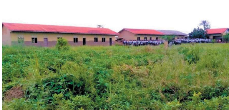
Žáci před našimi prvními školními budovami...

díky vaší neutuchající podpoře se všichni žáci naší zemědělsko-chovatelské školy v Mabale stále vzdělávají, a to i v praktické výuce. Konžské ministerstvo školství zatím nevyplácí žádné učitele v nových středních školách, ani v té naší. Protože však chceme dát žákům možnost navštěvovat naši školu, aniž by museli platit školné, nadále hradíme platy učitelů