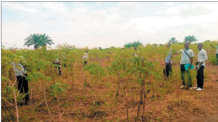
Výuka na maniokovém poli téměř připraveným ke sklizni

proto je tato země nadále vykořisťována nadnárodními společnostmi, které si platí milice a povstalecké skupiny, jež neustále ničí vesnice, znásilňují ženy a zabíjejí muže, aby vyhnaly místní obyvatelstvo z těchto oblastí bohatých na suroviny na východě Konga. Za posledních 20 let byly v této oblasti zabity a vysídleny již miliony lidí. A kdo o této tragédii ví? Naše kniha odhaluje příběh o tom, co se za tím vším skrývá.