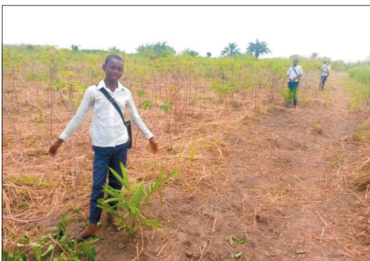
Pyšní žáci se chlubí palmami, které zasadili na poli s maniokem

Ještě jednou děkujeme za vaši pomoc a podporu. Naši žáci, učitelé i lidé v Kongu si velice váží všeho, co pro ně děláte.