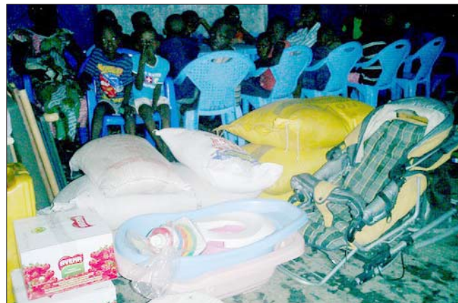
Distribuce bezplatných vzděl. materiálů ve školách a sirotčincích v Kinshase. Potraviny a další dary pro sirotky.

našich letenek, což je pro naši práci obrovská pomoc. Nadace Vodacom přislíbila dar školních lavic a stolů. Další lidé nás povzbudili velkorysími finančními dary a zároveň přislíbili, že pro nás budou hledat další příznivce. Můžeme děkovat všem za Vaši pomoc!