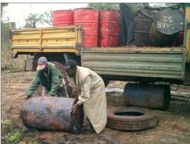
Dvacet 200-litrových barelů vody na staveništi.