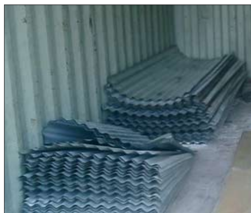
Dřevěná prkna a trámy na střešku, dveře atd. Železné pruty do základů a do sloupů. Vlnitý plech na střešku.