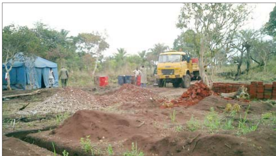
Staveniště: stan ostražky, barely s vodou, písek a štěrk