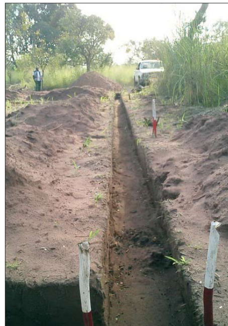
Výkopová jáma pro základy budoucí školy.

Před tím než jsme mohli odjet do Mushapa, jsme se v Kinshase setkali s mnoha starými i novými přáteli. Všichni projevovali velký zájem o náš projekt a zároveň i velkou ochotu nám pomoci. Např. letecká společnost CAA, která zajišťuje lety mezi Kinshasou a Tshikapem (nejbližším velkým městem v sousedství Mushapa), přislíbila pravidelné sponzorství