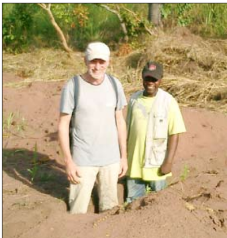
Jos a Jean ve vykopaných základech. Maniok je nutné namočit, aby se zbavil kyselosti. Mladá matka s dítětem a 30 kg manioku.