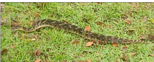
Tahle zmije, byla záhy zkonsumována hladovými vesničany. Považují ji za opravdovou lahůdku!